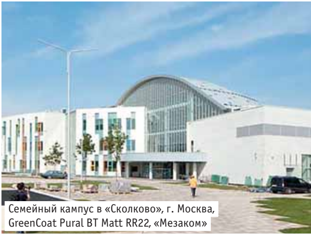
Семейный кампус в «Сколково», г. Москва, GreenCoat Pural BT Matt RR22, «Мезаком»