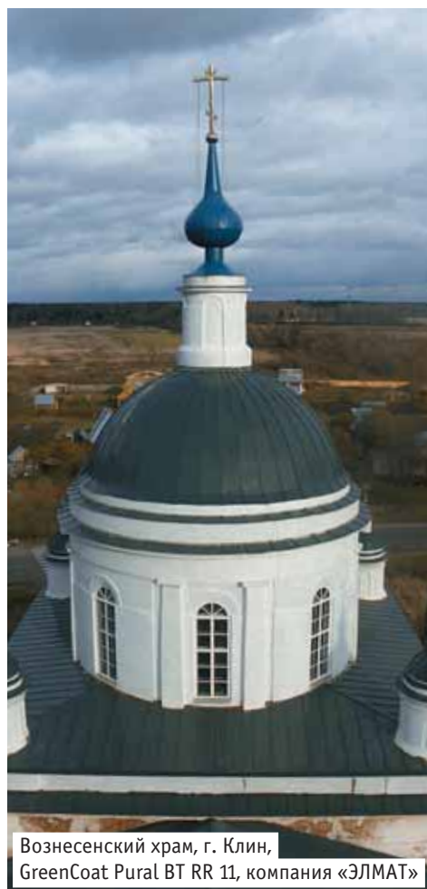
Вознесенский храм, г. Клин, GreenCoat Pural BT RR 11, компания «ЭЛМАТ»