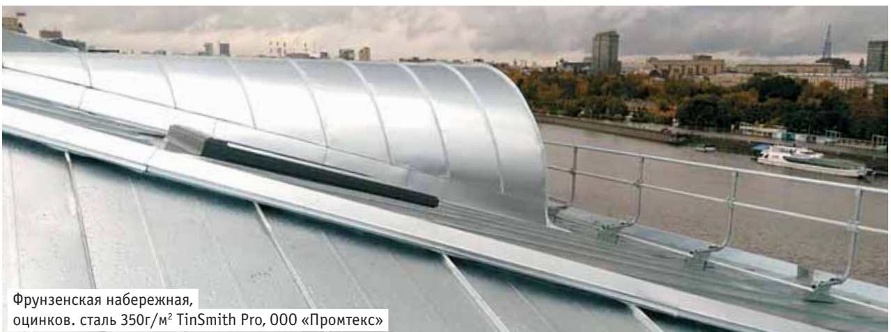
Фрунзенская набережная, оцинков. сталь 350г/м 2 TinSmith Pro, 000 «Промтекс»