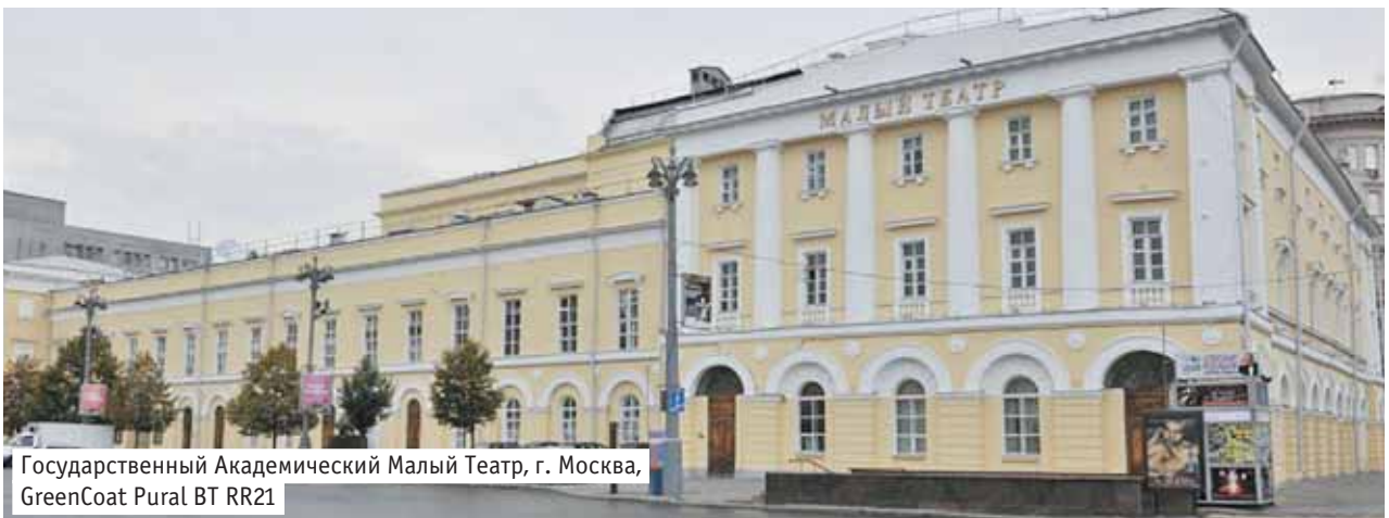
Государственный Академический Малый Театр, г. Москва, GreenCoat Pural BT RR21