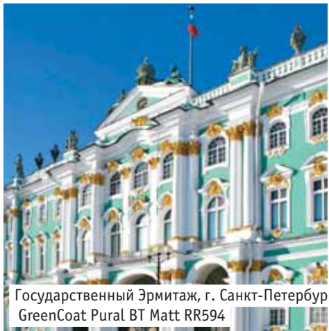
Государственный Эрмитаж, г. Санкт-Петербург, GreenCoat Pural BT Matt RR594