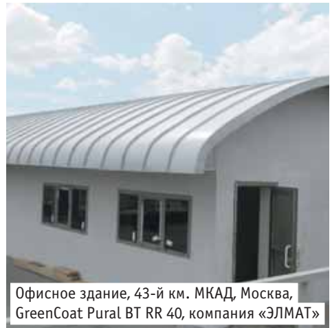
Офисное здание, 43-й км. МКАД, Москва, GreenCoat Pural BT RR 40, компания «ЭЛМАТ»