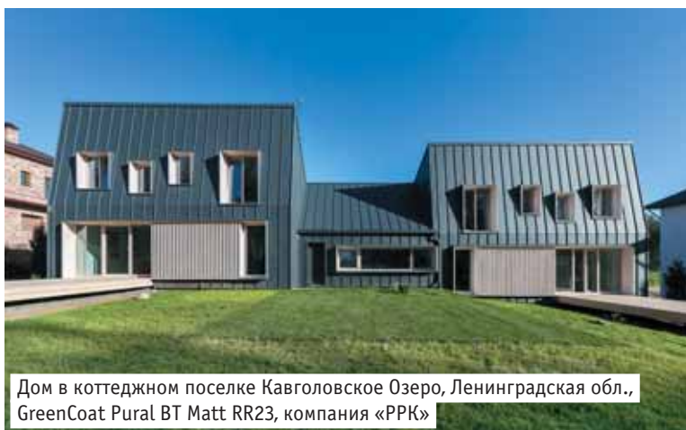
Дом в коттеджном поселке Кавголовское Озеро, Ленинградская обл., GreenCoat Pural BT Matt RR23, компания «РПК»