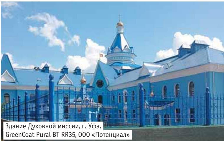
Здание Духовной миссии, г. Уфа, GreenCoat Pural BT RR35, 000 «Потенциал»