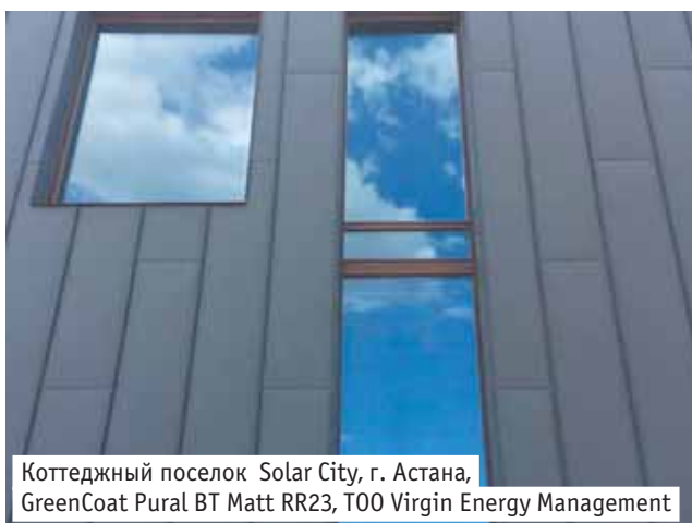
Коттеджный поселок Solar City, г. Астана, GreenCoat Pural BT Matt RR23, TOO Virgin Energy Management